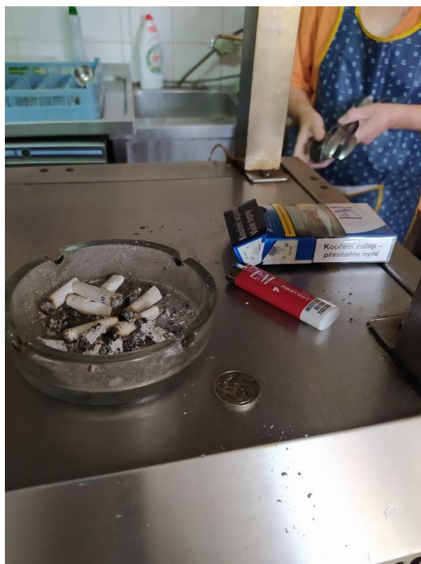
Foto č. 2 Nedostatek –popelník s nedopalky od cigaret v přípravně