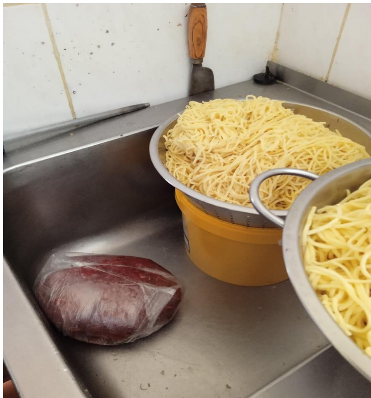
Foto č. 1 Nedostatek – nedodržení úseku vytvořených pro jednotlivé pracovní činnosti